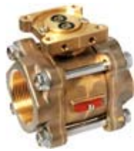
GL - резьбовое латунь Ду 15-40 мм (1/2" – 1 1/2")