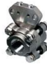
GSS – резьбовое нерж.сталь (SS316) Ду 15,20 и 40 мм (1/2", 3/4" и 1")