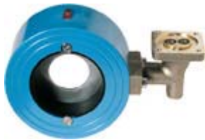
FA - межфланцевое материал: Ду 15-40 мм: медный сплав Ду 50-400 мм: чугун с эпоксидным покрытием, устанавливается между двумя фланцами, которые стягиваются болтами друг с другом