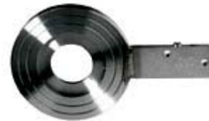
FSS – межфланцевое материал: нерж.сталь (SS316) Ду 15 - 500 мм (1/2" - 20"), устанавливается между двумя фланцами, которые стягиваются друг с другом

Подробнее об измеряемых диапазонах на следующей странице